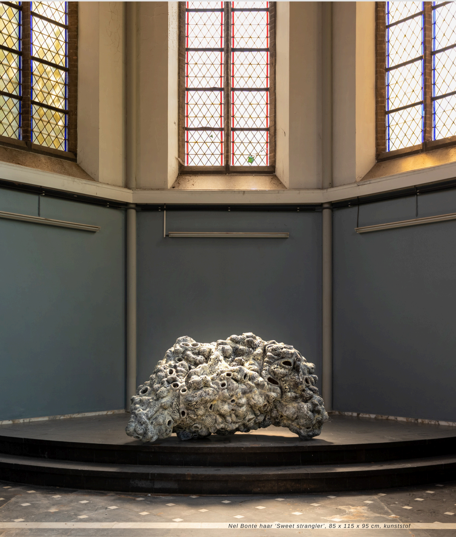
Nel Bonte haar 'Sweet strangler', 85 x 115 x 95 cm, kunststof